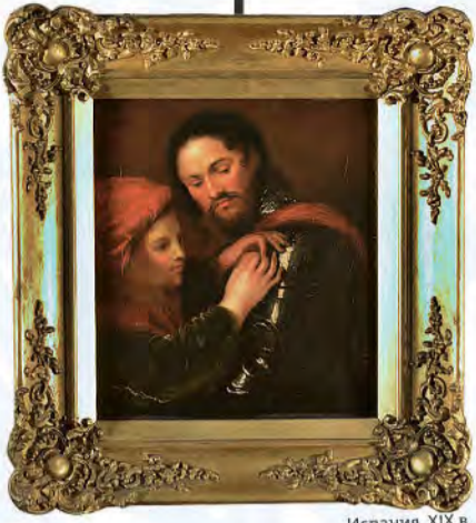
Испания. XIX в.

в больницу. И вот приехал к нему известный коллекционер и спрашивает, с кем он менялся, у кого взял эти картины. Да, говорит тот, у одного начинающего придурка из Ленинграда! Коллекционер говорит: подожди-подожди, это не Петрик ли случайно? Так ты не хвораи, вставай и радуйся, что легко отделался!